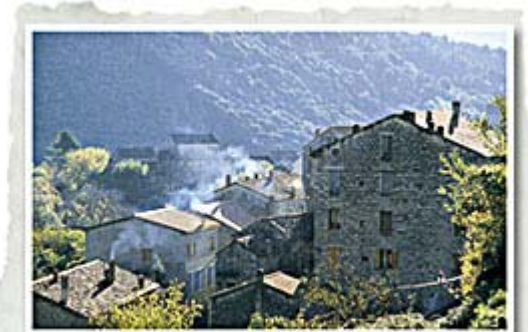
Village de Levie